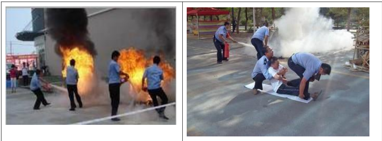
图表 12 科佳消防、应急预案演习