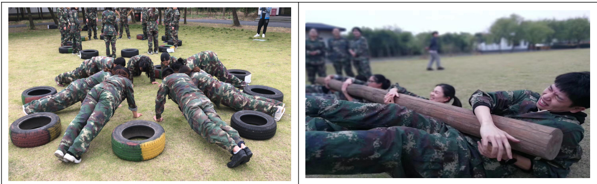
图表 9 员工活动图

建立了员工满意度管理制度，通过多种途径来识别影响员工满意的因素。针对不同的员工群体采用适当的方式，包括组织部门会议、职工代表会、新进员工座谈会、离职员工访谈，收集员工抱怨和投诉，开展专项调查等多种方式来识别影响员工满意的关键因素，最终确定影响整体员工满意的关键因素。