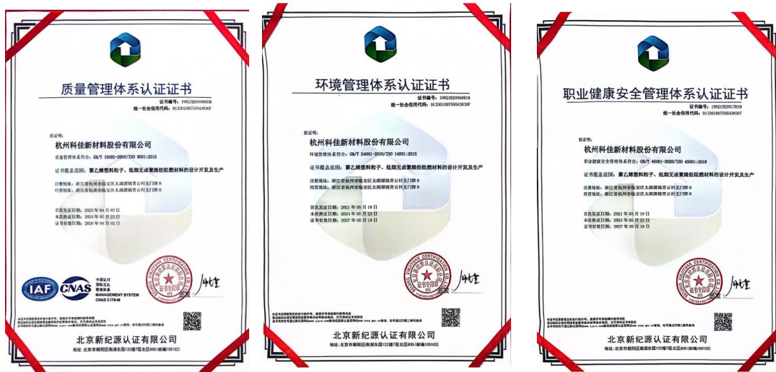
图表 4 体系认证证书

科佳于 2020 年导入“浙江制造”模式进行管理，结合质量、环境、职业健康安全、卓越绩效管理模式、质量诚信标准要求建立了综合型管理体系。