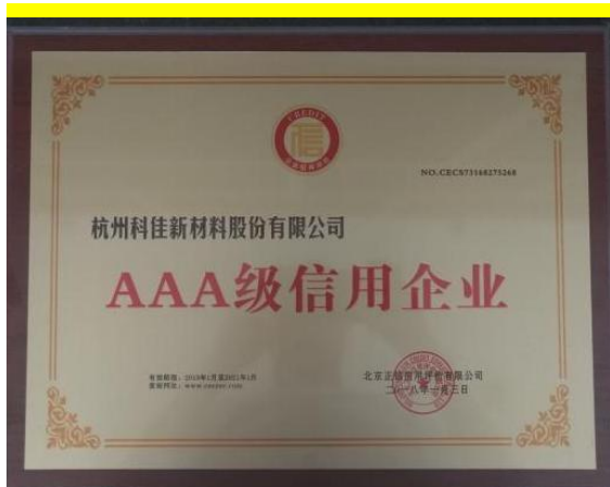
中国行业 AAA 级信用企业