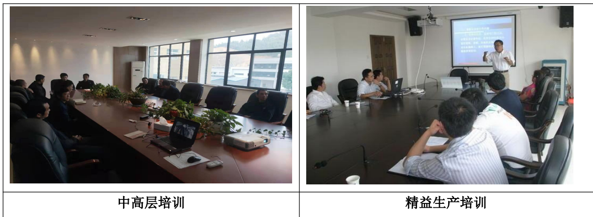
图表 8 员工培训

根据公司战略规划要求，为了更好的实现长短期战略目标和规划，根据绩效测量、绩效改进和技术变化的要求制定员工教育、培训计划，在分析各种需求与员工现有能力基础上，根据人力资源规划制定，“为每一个岗位的发展提供机会，为每一个员工的攀登创造条件”，我们本着“以德为先，以才为重，德才兼备，知人善用”的用人理念，将其作为建立完善培训管理体系的依据。