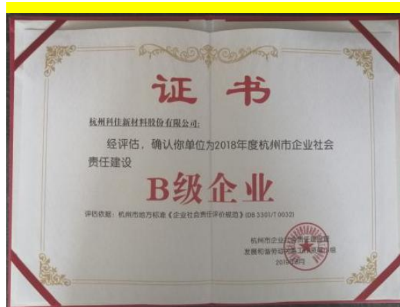
杭州市企业社会责任建设 B 级企业