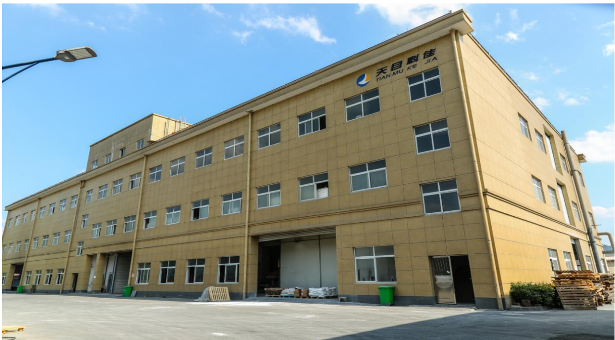
图表 1 公司总部厂区图

公司已先后获得“国家高新技术企业”、“浙江省科技型中小企业证书”、“杭州市高新技术企业研发中心”、“专精特新“小巨人”企业”。质量方面获得了质量环境安全管理体系（ISO9001、ISO 14001、ISO45001）认证。